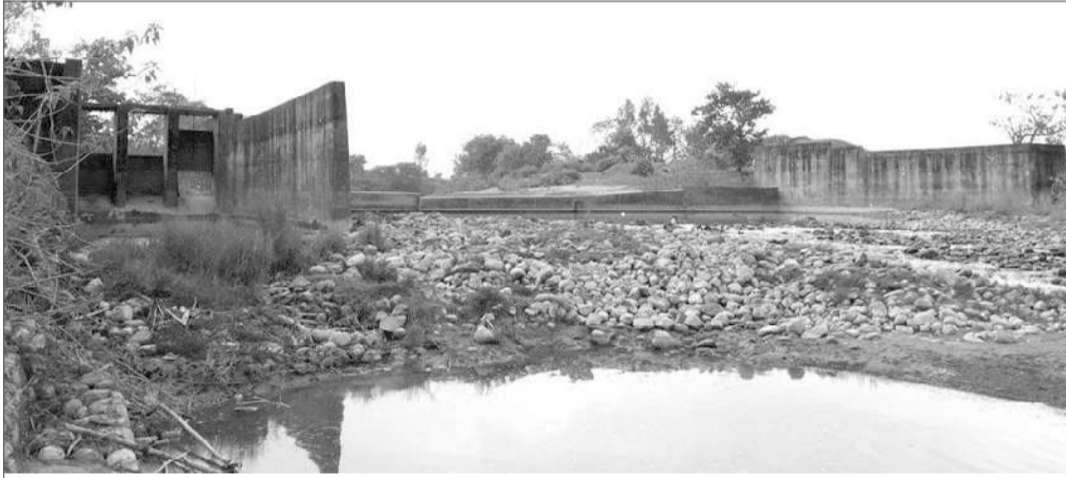
कैलालीके कैलारी गाउँपालिका २ स्थित भटकल अवस्थामे रहल गुरगी सिँचाइ आयोजना ।

पहुरा समाचारदाता धनगढी, ३ बैशाख । कैलालीके कैलारी गाउँपालिका २ स्थित गुरगी सिँचाइ योजना निर्माणमे अनिश्चितता देखल गेल बा ।