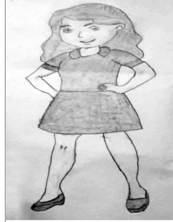
निसम चौधरी, कक्षा: ७ सरस्वती मावि, धनगढी, कैलाली