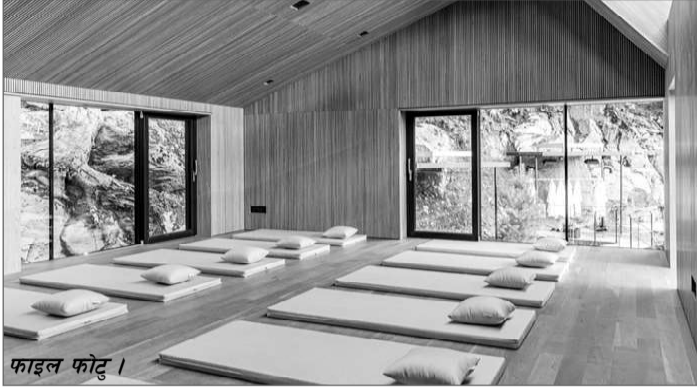
फाइल फोटो ।

वडाध्यक्ष बस्नेतके अनुसार भवनहे आवश्यकता अनुसार पाटी प्यालेसके रूपमे समेत प्रयोग करे सेकजैना मेरके संरचना निर्माण हुइटी रहल बा । स्थानीयस्तरमे सभा, गोष्ठी, तालिम तथा सामुदायिक कार्यक्रम सञ्चालनके लाग उपयुक्त स्थानके