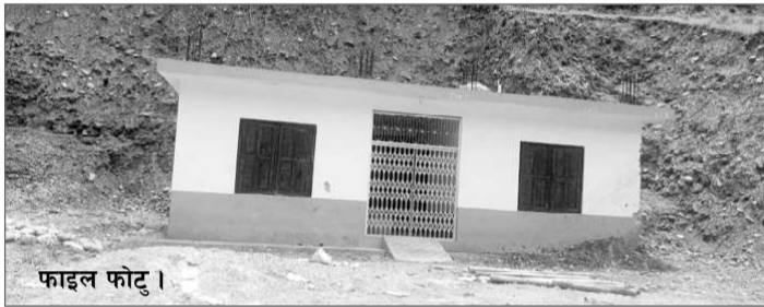
फाइल फोटो ।

“सेवा विस्तार करजैना सर्पदंश उपचार केन्द्रमे उपचार सेवा प्रभावकारी बनाइक लाग स्वास्थ्यकर्मीके क्षमता अभिवृद्धि करल बा”, उहाँ कहलै, “ग्रामीण भेगके नागरिकहे समयमे उपचार सुनिश्चित कैना चिकित्सक तथा आकस्मिक विभागमे कार्यरत स्वास्थ्यकर्मीके लाग दुई दिने विशेष तालिम सञ्चालन कैके सर्पदंश उपचारमे दक्ष बनाइल बा ।” ओहकान अनुसार जिल्ला सदरमुकाममे रहल अस्पतालमे भर सर्पदंशके उपचार सेवा पहिलेसे निरन्तर रूपमे सञ्चालनमे रहल बा । ग्रामीण तथा दुर्गम क्षेत्रमे उपचार सेवा नैहोके बिरामी अकालमे ज्यान गुमाइ