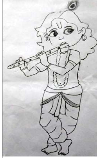
नेहारिका राना, कक्षा: ४ डिलाईट इंग्लिस स्कूल धनगढी, कैलाली