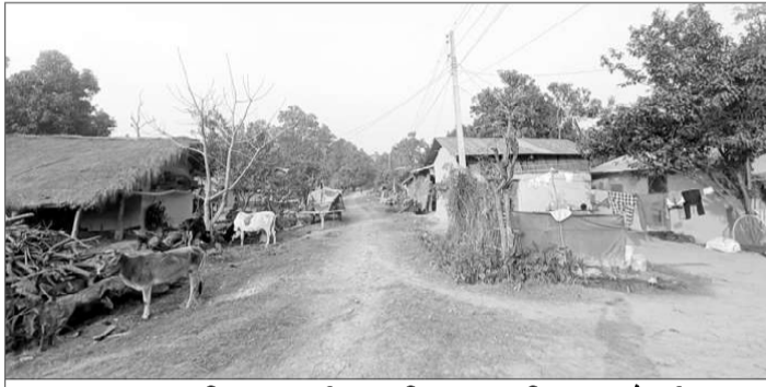
डुवान प्रभावितके बस्ती ।

२०६४ ओ ६५ के बाढसे बस्ती तहसनहस पारलपाछे विपत्तमे परल कैलाली गाउँपालिका-७ भुइयाँफाँटासहित छटकपुर बसन्ता ओ अन्य वडाके विस्थापित वन क्षेत्रके जगामे बैठटी आइल बटै । मोहना लडियासे गाउँ कटान करलपाछे भुइयाँफाँटा गाउँ पुरे विस्थापित हुइल रहे । ओस्टेक करके, पाछे कटैनी